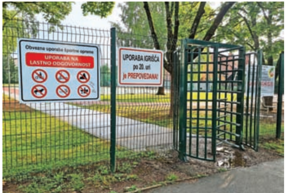
Igrišče je v celoti označeno s tablami, ki jasno določajo pravila uporabe, kar naj bi bilo izhodišče za ukrepanje pristojnih služb.

Z nevzdržnim stanjem so že več kot leto dni seznanjeni ključni deležniki v KS Vodovodni stolp, na osnovni šoli, policiji in v vodstvu občinske uprave, je pojasnil Traven in predlagal strožja pravila in pogoje uporabe in prehoda športnega igrišča, ki bi jih morala vodstvo šole in Mestna občina Kranj (MOK) kot lastnica objekta izobesiti na vidno mesto. »Omenjeno igrišče je bilo zgrajeno in postavljeno dobesedno pod okna spalnic hiš tik ob igrišču. Nobeno športno igrišče ne stoji tako blizu stanovanjskih hiš, kot stoji prav to pred Osnovno šolo Simona Jenka. Naj v vednost povem, da so hiše stale na tem mestu veliko prej, preden so zgradili šolo in igrišče, zato bi morala, upoštevajoč specifičnosti lokacije igrišča, za uporabo tega veljati druga, strožja pravila,« pojasnjuje. Traven je v dopisu še predlagal zaklepanje igrišča med 22. in 7. uro ter javno