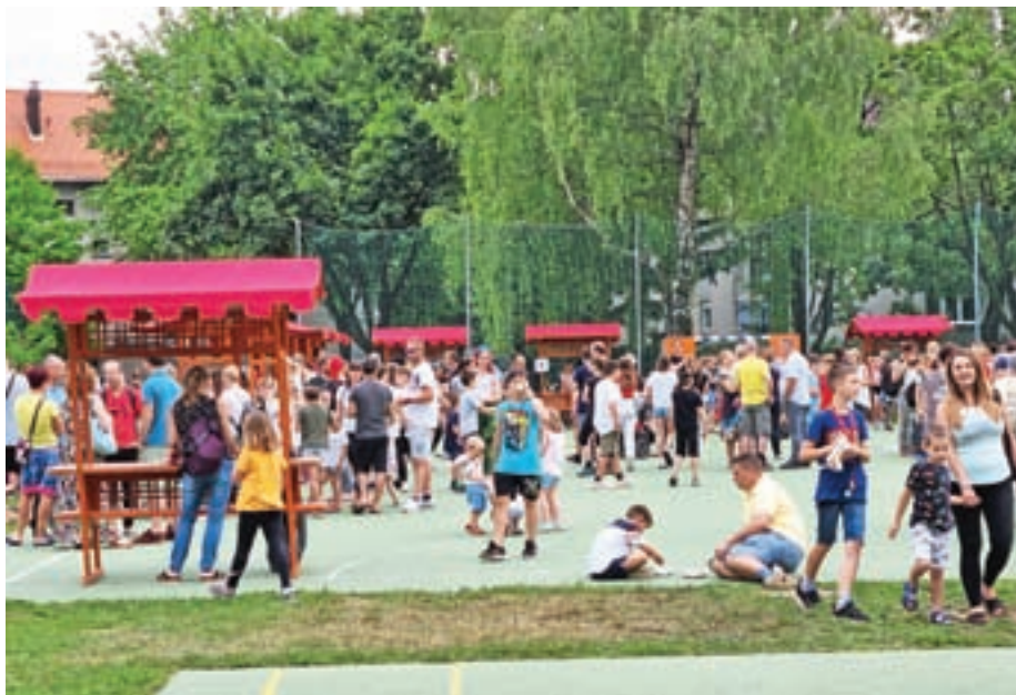
Dobrodelni piknik na centralni šoli je bil zelo dobro obiskan.

Novoletni bazar, s katerim zbirajo sredstva za šolski sklad, ki ga v zadnjih treh letih zaradi epidemije ni bilo, so letos izvedli proti koncu leta – 16. junija, kar se je izkazalo za dobro odločitev. Na eni strani so bili v pripravo dobrodelnega piknika vpeti vsi na šoli, po drugi strani je bazar tudi ponudil možnost sproščenega druženja na zunanjih igriščih. »To je bilo prvič v vseh enotah – in ne zadnjič. Ugotovili smo namreč, da se na ta način lahko zelo dobro povežemo