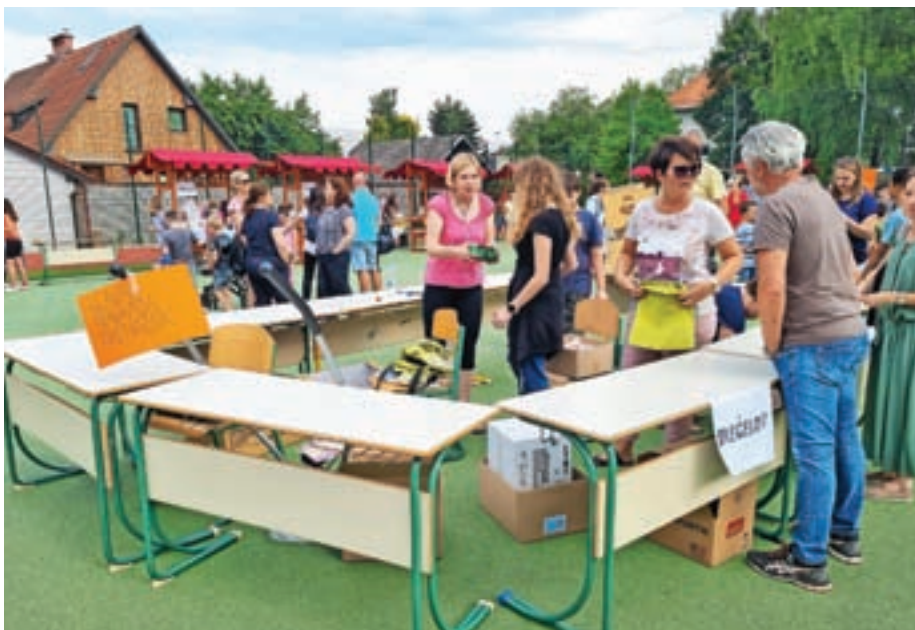
Na zaključnem pikniku se je za šolski sklad na vseh treh šolah nabralo 7.500 evrov, tudi zaradi uspešnega srečelova.

z lokalno skupnostjo, tudi sosedje lahko malo 'zadihajo' z nami, četudi nas morajo včasih trpeti. Mislim, da smo vsi preživeli zelo lepo popoldne, tako da bomo v naslednjih letih namesto novoletnega bazarja poskušali na tak način proslaviti konec šolskega leta,« razmišlja ravnateljica.