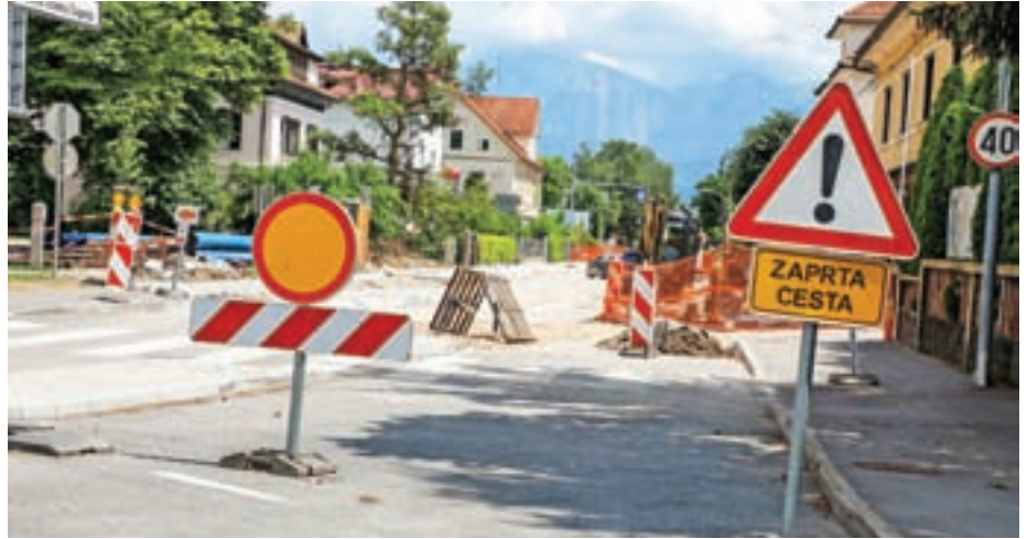
Cesta Staneta Žagarja bo popolnoma zaprta še do konca julija. / Foto: Tina Dokl

Na Cesti Staneta Žagarja še naprej poteka gradnja kolesarske povezave Športni park Kranj–Avtobusna postaja Kranj,