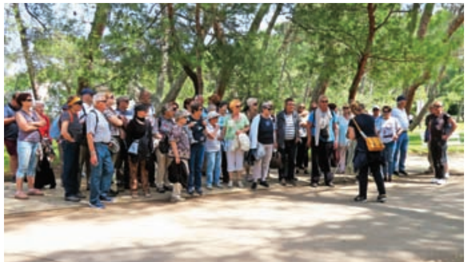
Z zadnjega skupnega izleta na Brionih

Sledil bo voden ogled samostana Studenec svete Marije, pri domačinih imenovanega kar Grad Kostanjevica. Zgrajen je bil leta 1234, in sicer južno od naselja Kostanjevica na Krki. Ustanovil ga je koroški vojvoda Bernard Spanheimski z ženo Juto. Samostan je znan po nekdanji samostanski cerkvi in najboljše-nej-