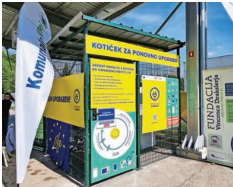
E-kotiček deluje v Zbirnem centru Zarica.